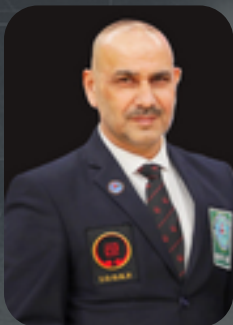
ПРЕЗИДЕНТ МЕЖДУНАРОДНОЙ ФЕДЕРАЦИИ ДЖУГО КОБУТЭ И КЭМПО-РЮ ТАРВЕРДИ АЛЛАХВЕРДИЕВ (АЗЕРБАЙДЖАН)

ОТ ЛИЦА ПЕРВЫХ ЛИЦ ФЕДЕРАЦИЙ, МЫ РАДЫ ПРИВЕТСТВОВАТЬ ВАС НА ЭТОМ ЗНАЧИМОМ СОБЫТИИ.