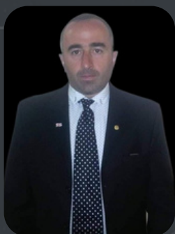
ПРЕЗИДЕНТ НАЦИОНАЛЬНОЙ ФЕДЕРАЦИИ КЭМПО ГРУЗИИ ИРАКЛИ ТУГУШИ (ГРУЗИЯ)

«УВАЖАЕМЫЕ УЧАСТНИКИ И ТРЕНЕРЫ! РАД ПРИВЕТСТВОВАТЬ ВАС НА ЭТОМ ЗНАЧИМОМ СОБЫТИИ. МЫ ПРИЛОЖИЛИ МАКСИМУМ УСИЛИЙ, ЧТОБЫ СОЗДАТЬ ДЛЯ ВАС КОМФОРТНЫЕ УСЛОВИЯ ДЛЯ СОРЕВНОВАНИЙ. ПУСТЬ ЭТОТ ЧЕМПИОНАТ СТАНЕТ ЯРКИМ И ЗАПОМИНАЮЩИМСЯ ДЛЯ ВСЕХ НАС. УДАЧИ И ЧЕСТНЫХ ПОБЕД!»