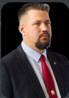
ДИРЕКТОР ГЛОБАЛЬНОГО УПРАВЛЕНИЯ ФЕДЕРАЦИЙ СМЕШАННЫХ ЕДИНОБОРСТВ МИХАИЛ МАХНЕВ (РОССИЯ)

«ДОРОГИЕ ДРУЗЬЯ! МЫ РАДЫ ПРИВЕТСТВОВАТЬ ВАС НА ЧЕМПИОНАТЕ ЕВРОПЫ ПО КЭМПО И СМЕШАННЫМ ЕДИНОБОРСТВАМ. ЭТО МЕРОПРИЯТИЕ СОБРАЛО ЛУЧШИХ СПОРТСМЕНОВ СО ВСЕГО КОНТИНЕНТА, И МЫ УВЕРЕНЫ, ЧТО ВЫ ПРОДЕМОНСТРИРУЕТЕ ВЫСОКОЕ МАСТЕРСТВО И СПОРТИВНЫЙ ДУХ. ЖЕЛАЕМ ВСЕМ УДАЧИ И ЯРКИХ ПОБЕД!»